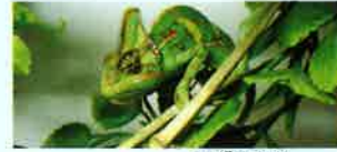
エボシカメレオン