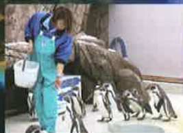
●フンボルトペンギン

フンボルトペンギンたちが、陸上をよちよち歩く姿や、飛ぶように泳ぐ姿をご覧ください。