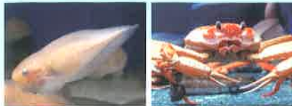
●ザラビクニン ●ベニズワイガニ

日本海の深海の水温は約1℃、その中でもベニズワイガニ、ゲンゲなどの仲間たちが元気にくらしているんだよ。