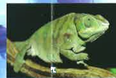
●パンサーカメレオン

魚類はもちろん、カエルやカメから樹上に暮らすカメレオンまで、幅広く展示しています。